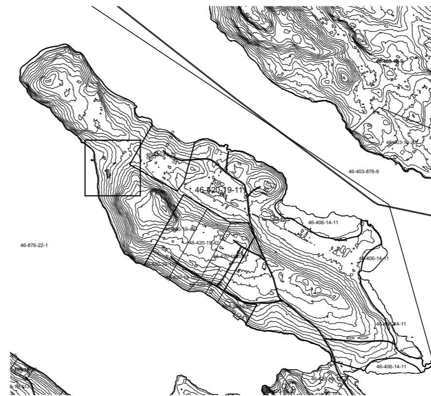
KARTTAOTE 1:10 000

HUOM! JOS TERASSIN JA MAANPINNAN TASOERO > 500 mm NIIN TERASSIN REUNAAN KAIDE TAI MAANPINNAN PENGERRYYS. KATETTU TAI LÄMMITETTY ULKOPORRAS: ETENEMÄ 300 mm TAI ENEMÄN JA NOUSU 160 mm TAI VÄHEMMÄN. KATTAMATON ULKOPORRAS: ETENEMÄ 390 mm TAI ENEMÄN JA NOUSU 130 mm TAI VÄHEMMÄN.